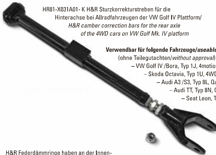
HR81-X031A01- K H&R Sturzkorrekturstreben für die Hinterachse bei Allradfahrzeugen der VW Golf IV Plattform/ H&R camber correction bars for the rear axle of the 4WD cars on VW Golf Mk. IV platform