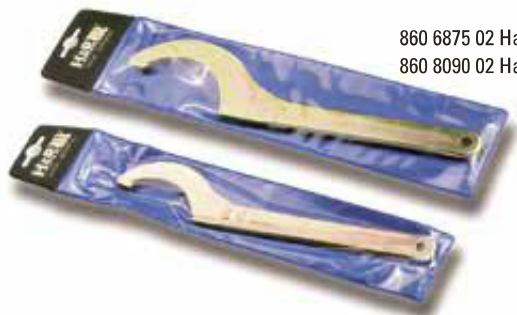
860 6875 02 Hakenschlüssel klein/Spanner Wrench, small 860 8090 02 Hakenschlüssel groß/Spanner Wrench, large

All parts of our shocks can be ordered separately. For an exact description of the parts, see the picture below.