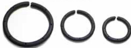
FDR-070: für Feder- Außen- \varnothing / for outer spring \varnothing approx. ca. 60-90 mm FDR-090: für Feder- Außen- \varnothing / for outer spring \varnothing approx. ca. 90-130 mm FDR-135: für Feder- Außen- \varnothing ab / for outer spring \varnothing approx. from ca. 130 mm

1-2 spring silencers are required per spring, depending on the progressive part of the specific spring.