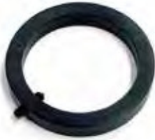
HR 80-K-X012A01 Fixieringsring für Gewindefahrwerke (Österreich) Locating ring for coil overs (Austria)