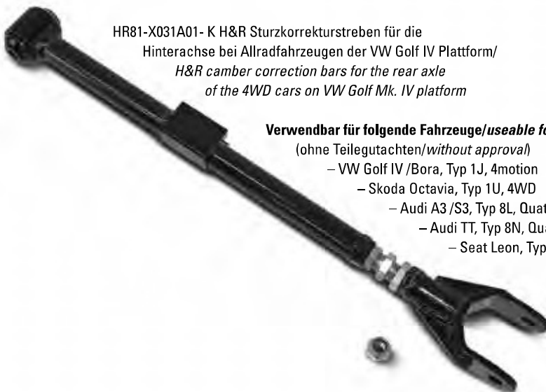
HR81-X031A01- K H&R Sturzkorrekturstreben für die Hinterachse bei Allradfahrzeugen der VW Golf IV Plattform/ H&R camber correction bars for the rear axle of the 4WD cars on VW Golf Mk. IV platform