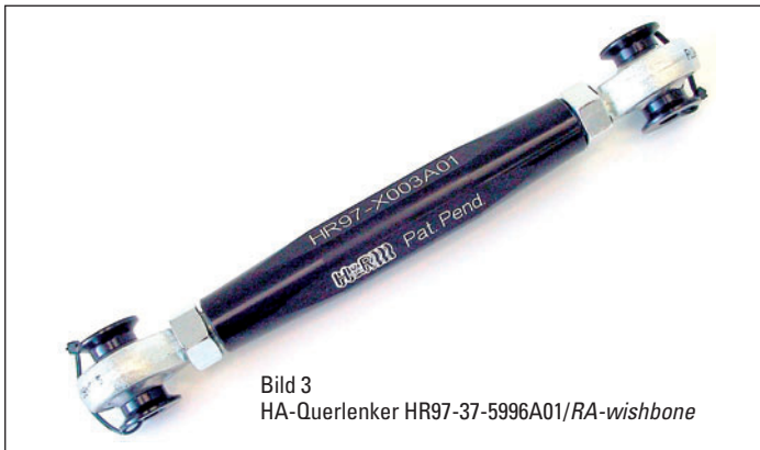
Bild 3 HA-Querlenker HR97-37-5996A01/RA-wishbone