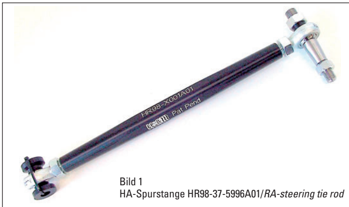
Bild 1 HA-Spurstange HR98-37-5996A01/RA-steering tie rod

Package 2: consisting of coil over suspension RSA-37-996-5/1-V and control arm package RFK-37-996-1/1