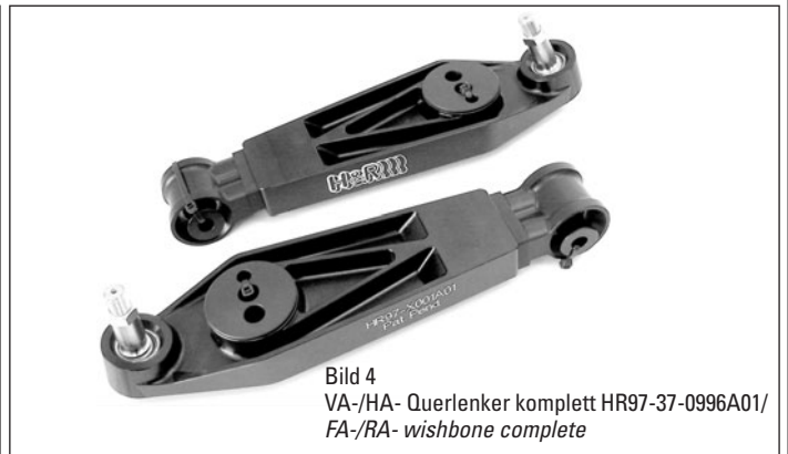
Bild 4 VA-/HA- Querlenker komplett HR97-37-0996A01/FA-/RA- wishbone complete