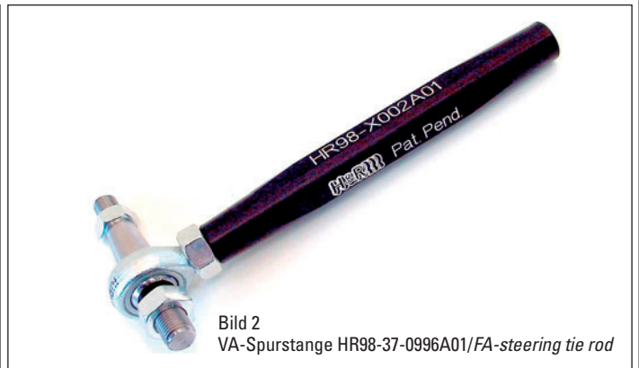
Bild 2 VA-Spurstange HR98-37-0996A01/FA-steering tie rod