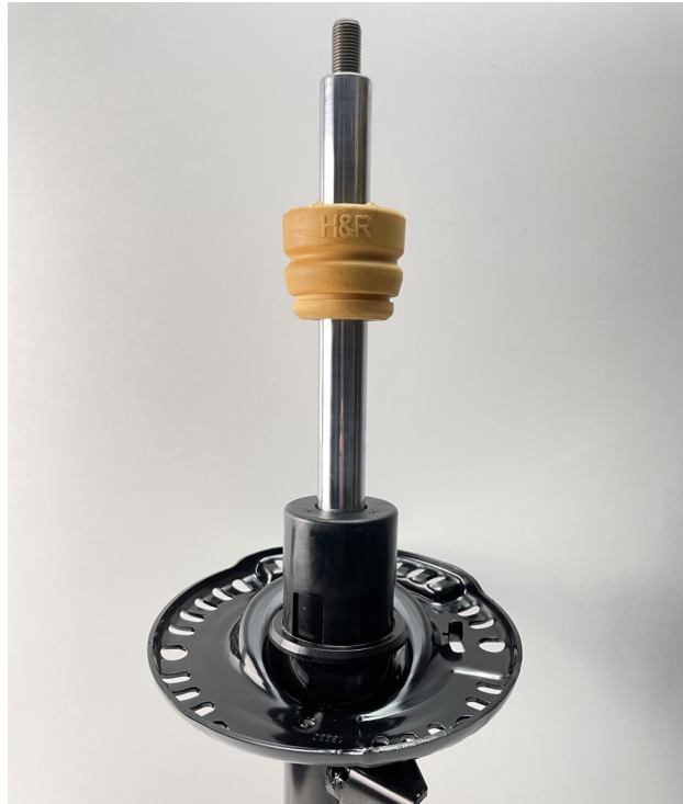
Abb. 1: H&R Anschlagpuffer montieren Fig. 1: Mount the H&R bump stop