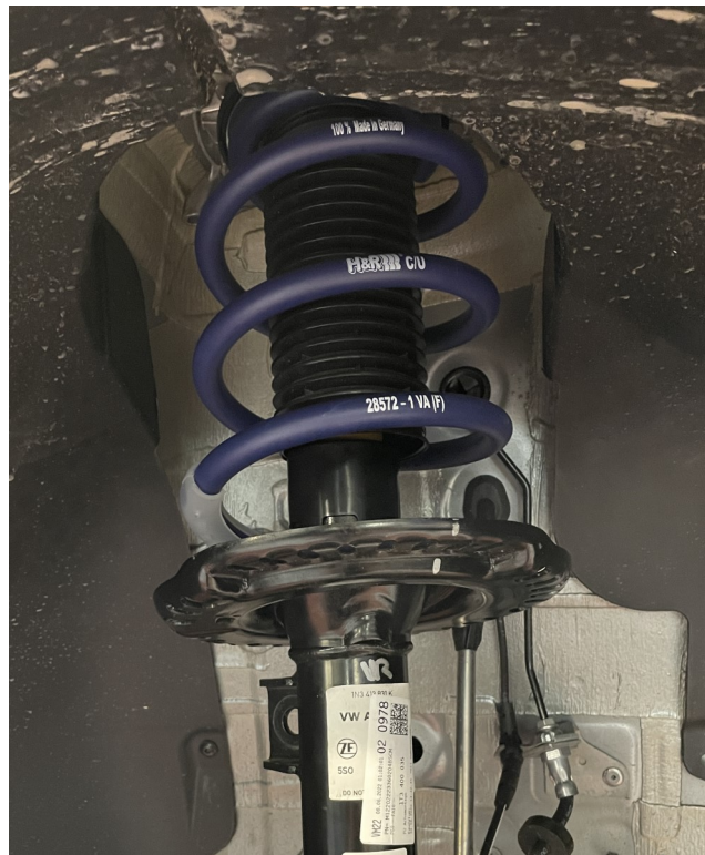
Abb. 2: Einbausituation (Abbildung ähnlich) Fig. 2: Installed condition (Fig. may vary)