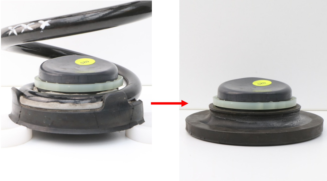
Abb. 3: Untere Federzentrierung wird wiederverwendet und mit dem Federgummi kombiniert Fig. 3: The lower spring centring has to be reused and combined with the spring rubber